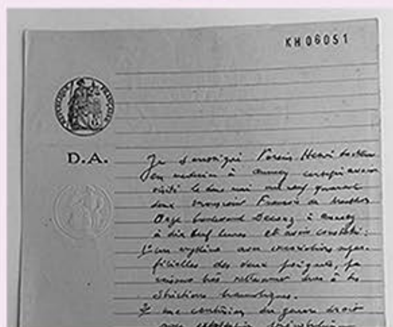
Plainte / certificat médical (2 mai 1942)