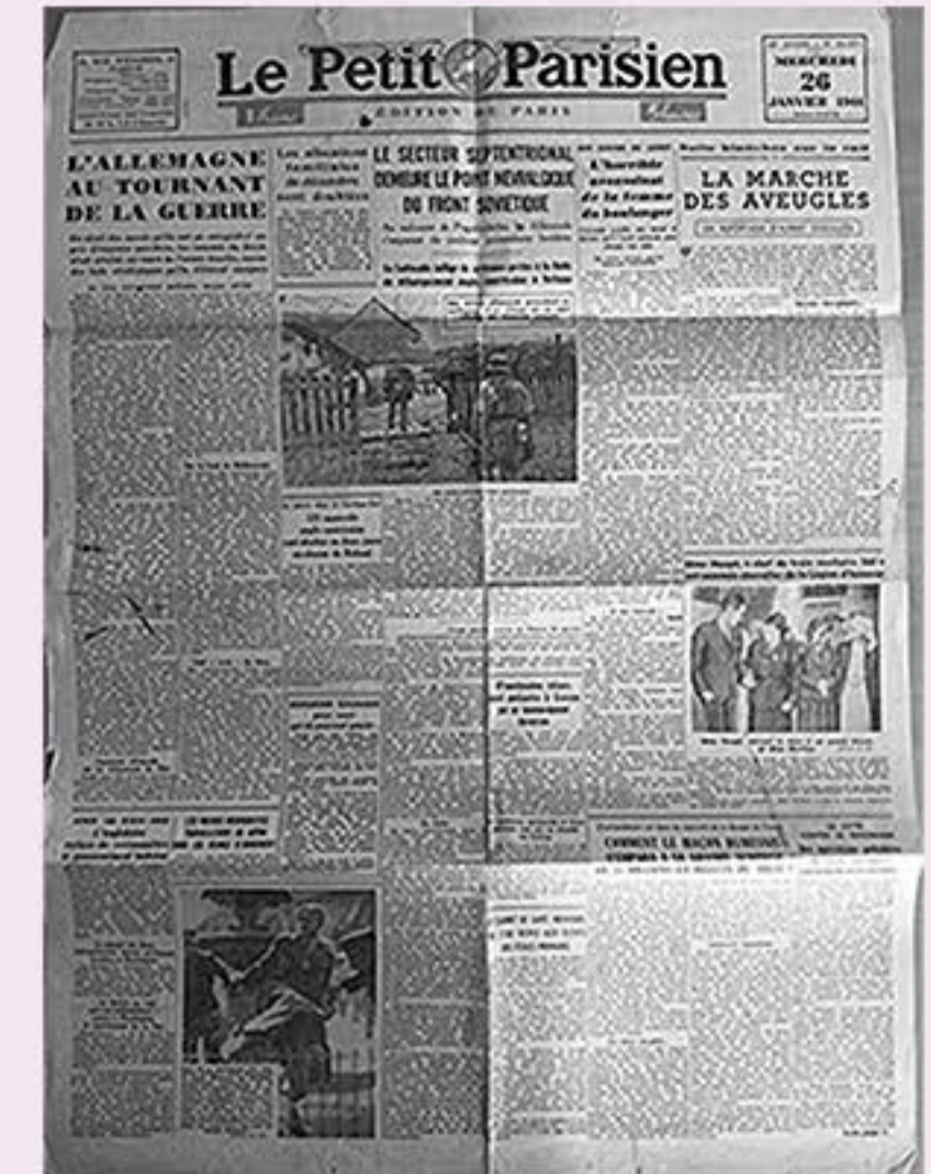
Une du journal "Le Petit Parisien" janvier 1944