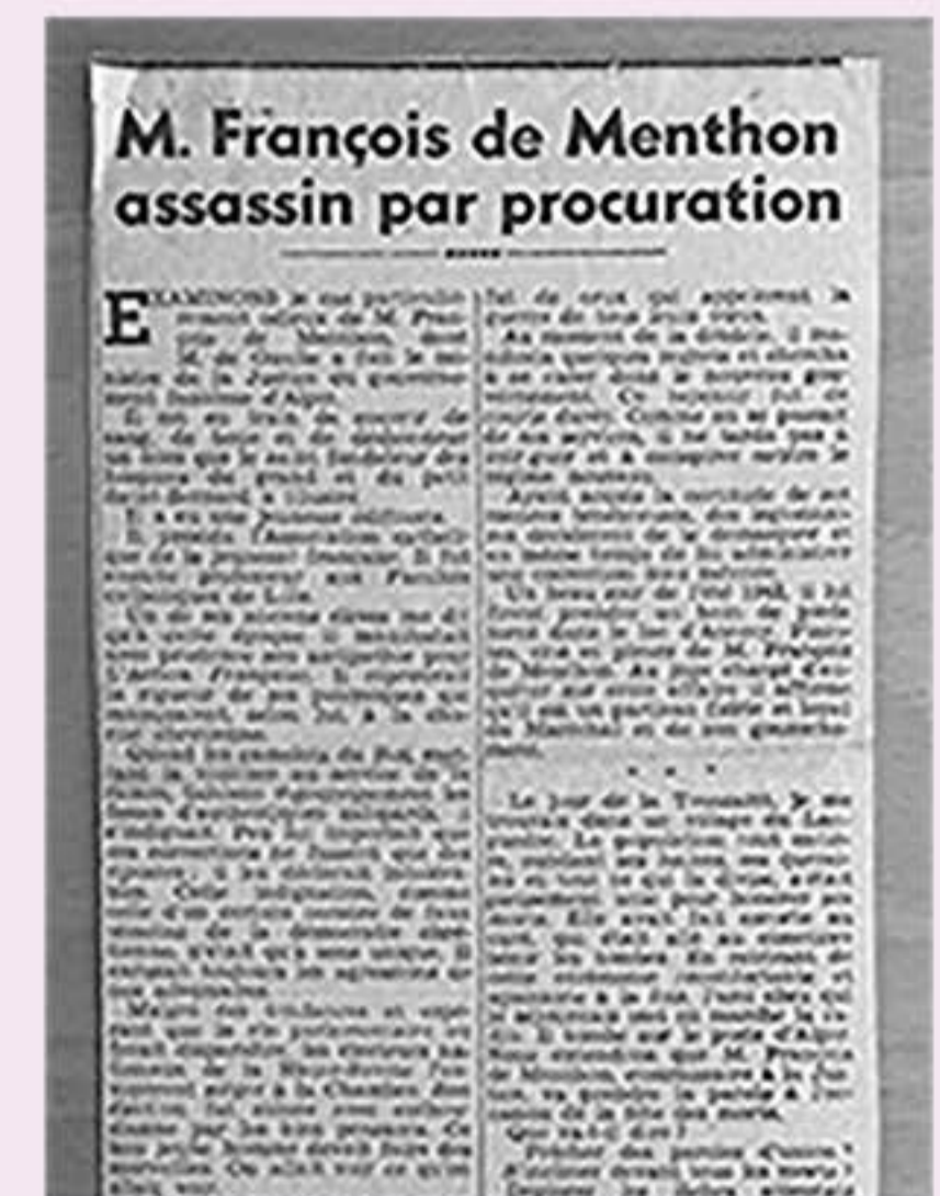
Article de presse "Le Petit Parisien", janvier 1944