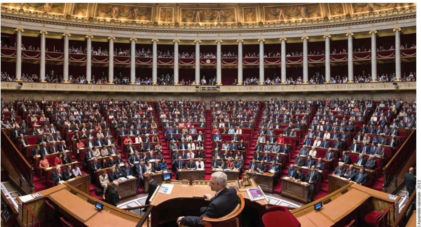
L'hémicycle de l'Assemblée nationale.

Benoît Falaize , université de Cergy-Pontoise