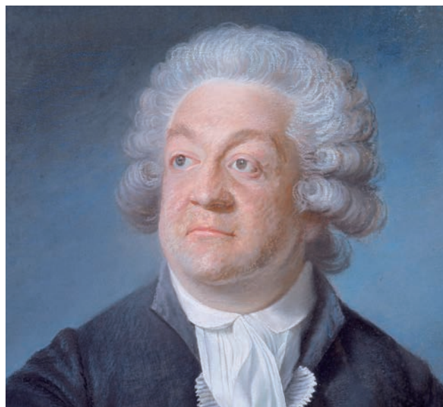
Honoré Gabriel Riqueti, comte de Mirabeau (1749-1791), homme politique français, écrivain et journaliste, portrait par Joseph Boze (1745-1826).

La Déclaration est l'œuvre collective de l'Assemblée constituante qui s'apprête à donner naissance à une monarchie constitutionnelle. Ses membres appartiennent pour l'essentiel à la bourgeoisie, à la noblesse et au bas clergé. Les débats ont été alimentés par de nombreux projets, dont ceux de Jean-Joseph Mounier (1758-1806), du marquis de La Fayette (1757-1834), de l'abbé Sieyès (1748-1836). Le texte présenté par le comte de Mirabeau (1749-1791), au nom d'un « Comité des cinq » chargé de faire la synthèse des projets, est rejeté le 18 août. Il inspire pourtant la rédaction de la Déclaration finale. Celle-ci est un texte de compromis, fruit de discussions parfois âpres.